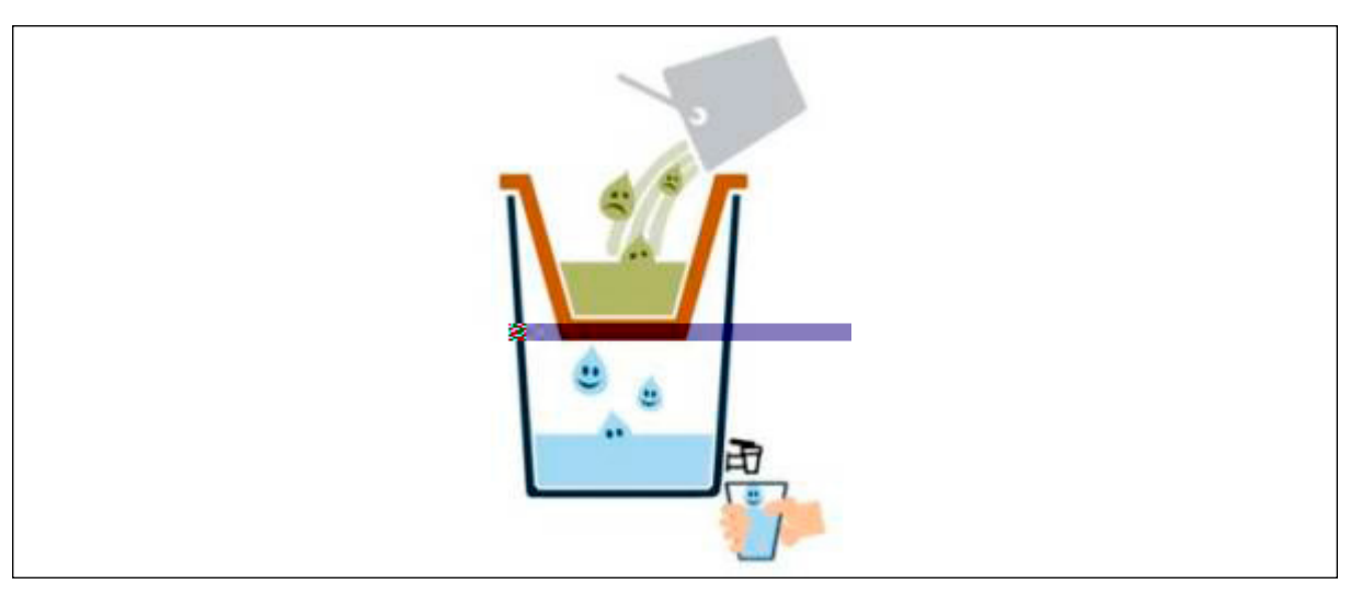
این.. 3. E®† هما هیهاهای او میلاده این است.